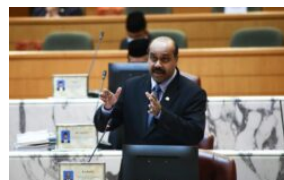
12 hospital Hibrid Covid di Johor