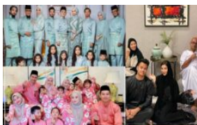
Lupa SOP, artis syok tayang gambar meriah...