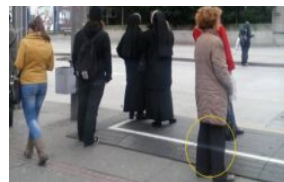
Rakam gambar 'hantu' di perhentian bas