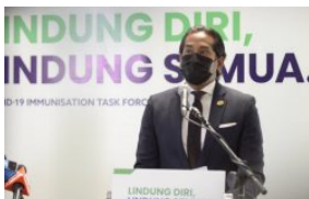
Guru sedang disenaraikan terima...