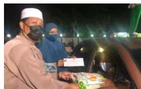
Kelantan sedia kemungkinan perintah...