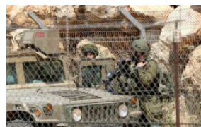
Rejim Zionis cuba perdaya pejuang...