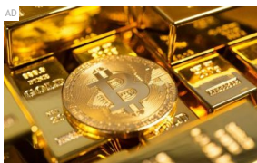
Inilah Cara Menjana Wang dengan Bitcoin